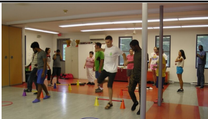
Au camp d'été dans le chalet du Parc Ste-Lucie