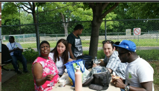
Au camp d'été, dîner par une belle journée ensoleillée