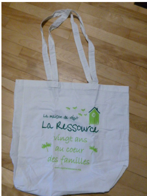
Exemplaire de sac donné à la fête du 20 e anniversaire

Au mois de mars 2020, nous sommes frappés par l'épidémie du Coronavirus. En quelques semaines à peine, nous sommes passés d'un monde plein de joie à un monde plein des restrictions, d'isolations et de quarantaines. Les nouvelles sont inquiétantes mais l'organisme prend toutes les mesures afin d'éviter la contagion. C'est ainsi que le 13 mars l'organisme décide de fermer et de suivre les consignes du gouvernement dont le confinement sauf pour les services essentiels.