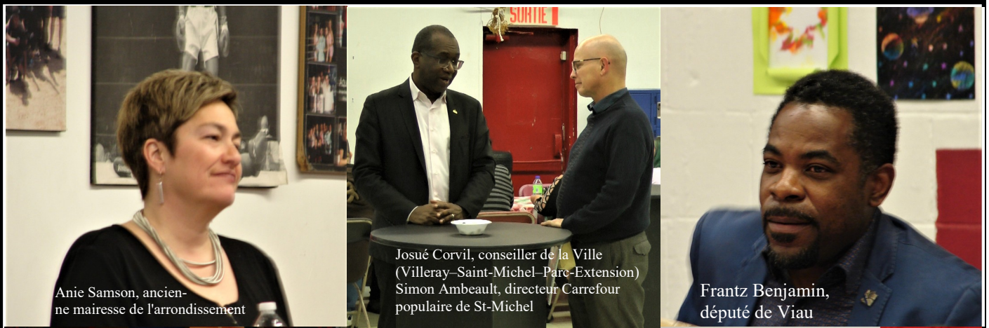
Anie Samson, ancienne mairesse de l'arrondissement